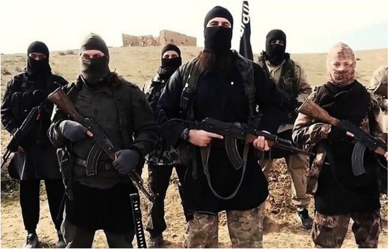
Des combattants de Daesh dans une vidéo de propagande