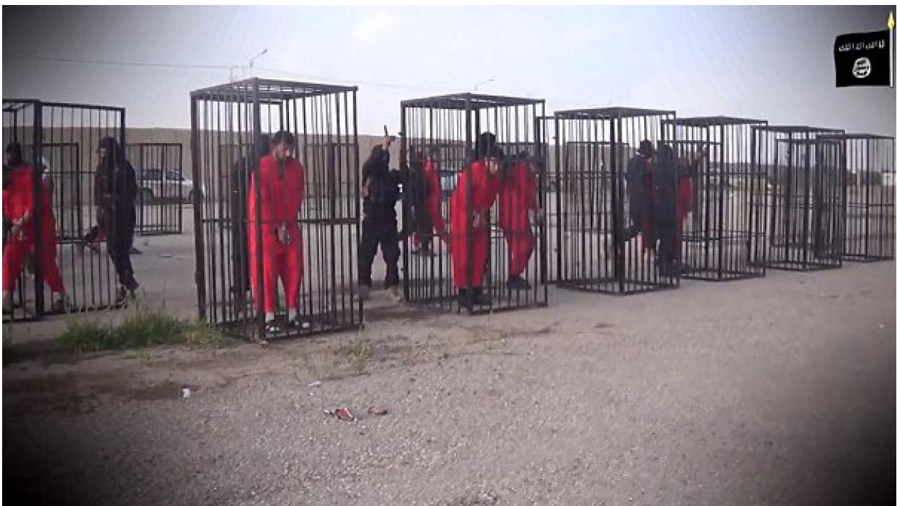
Des combattants kurdes enfermés dans des cages.